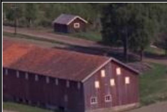
Fotografier - H :