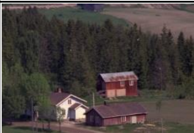
Fotografier - G :