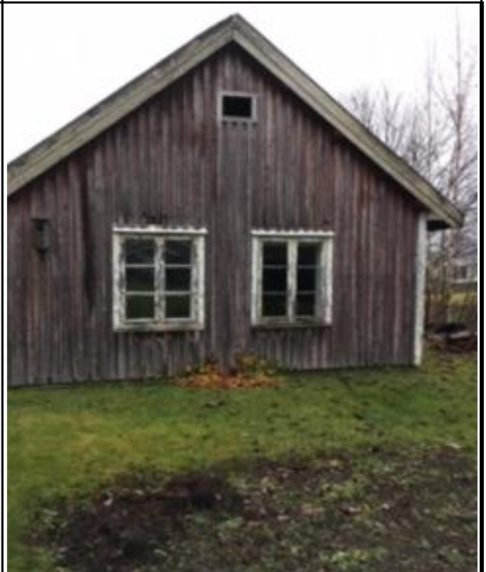
Fotografier - E :