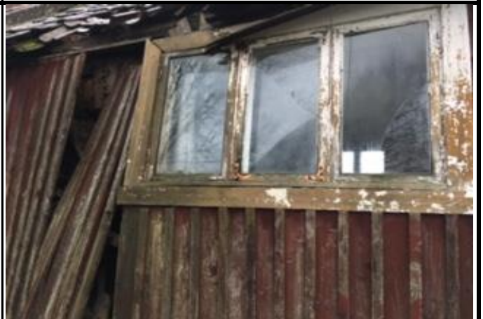
Fotografier - G :