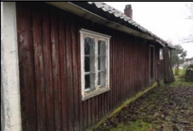
Fotografier - F :