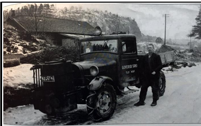
Fotografier - F :