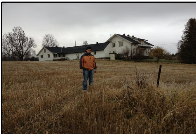
Fotografier - B :