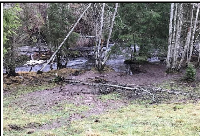
Fotografier - C :