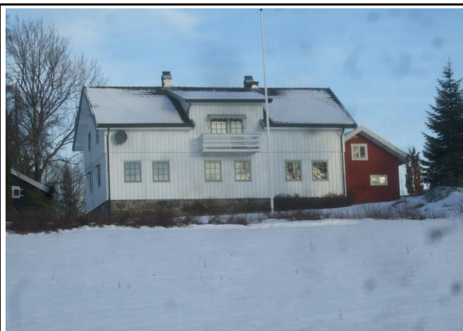
Fotografier - C :