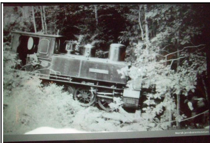
Fotografier - D: