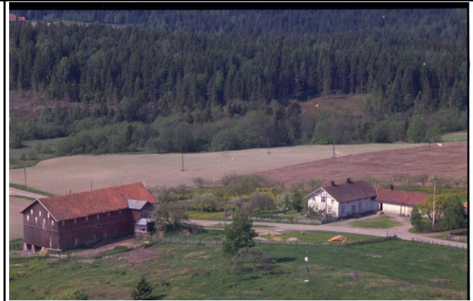
Fotografier - C :