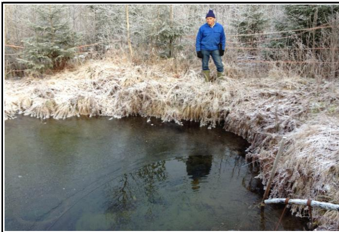
Fotografier - B :