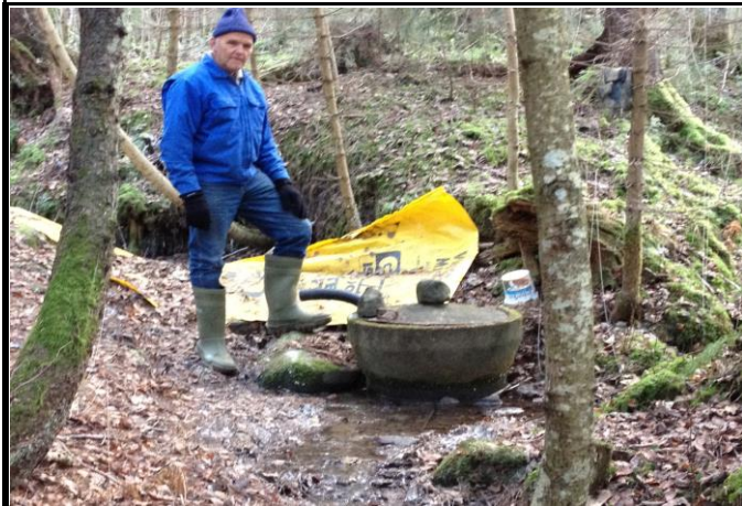
Fotografier - D :