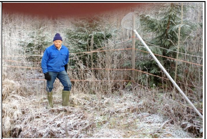
Fotografier - C :