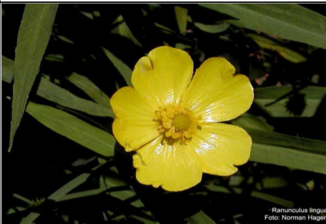
Ranunculus lingua