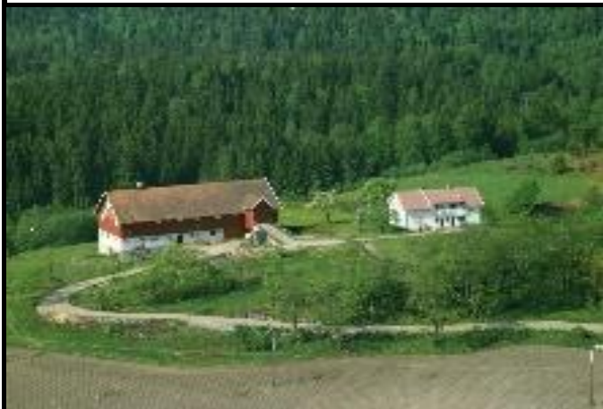
Fotografier - F :