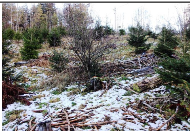
Fotografier - C :