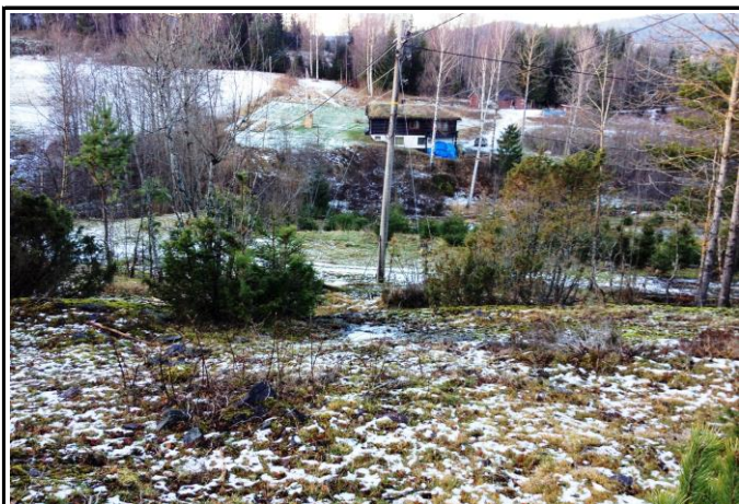
Fotografier - B :