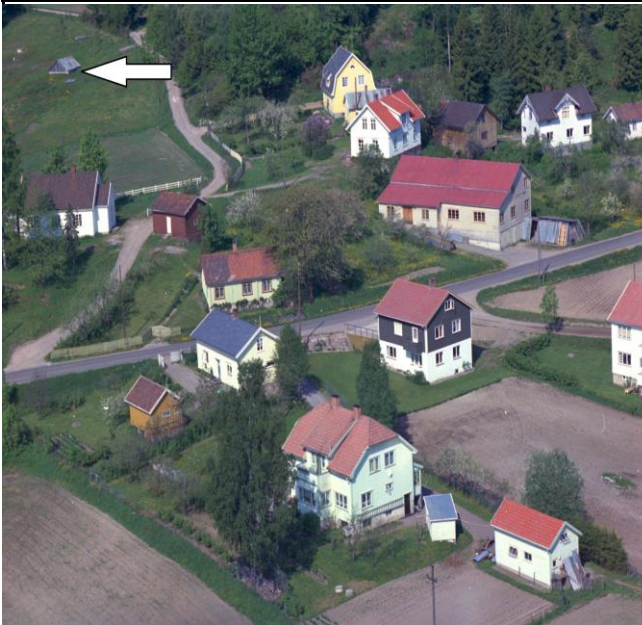
Fotografi - B