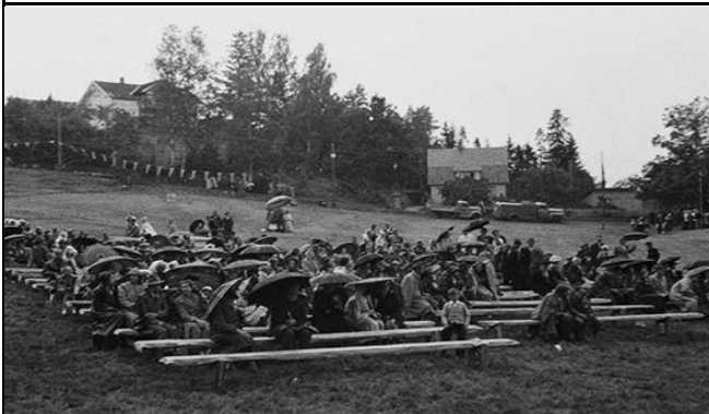
Fotografier - D: