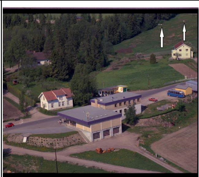
Fotografi - C :