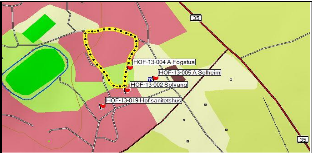
Fotografier - A :