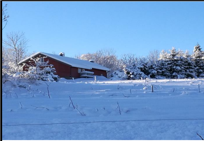
Fotografier - H :