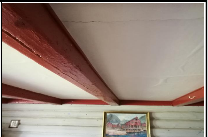
Fotografier - G :