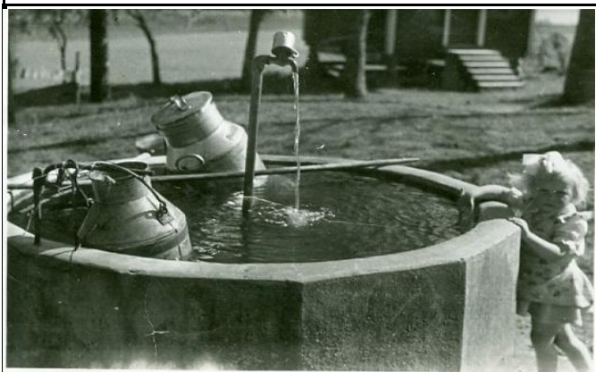
Fotografier - D :