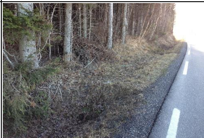
Fotografier - E :