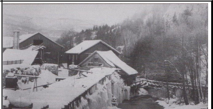
Islagt vannrenne ved øvre dam på Gata