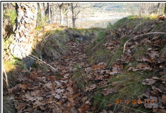
Fotografier - B :