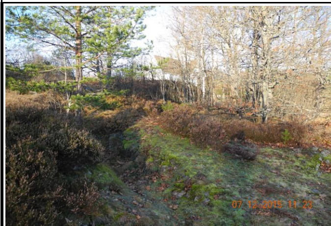
Fotografier - D :