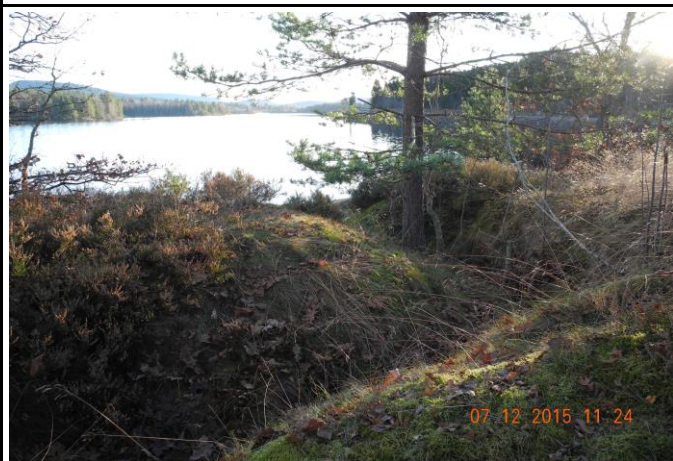
Fotografier - E :