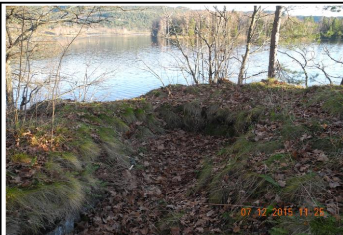
Fotografier - C :