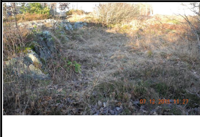
Fotografier - F :