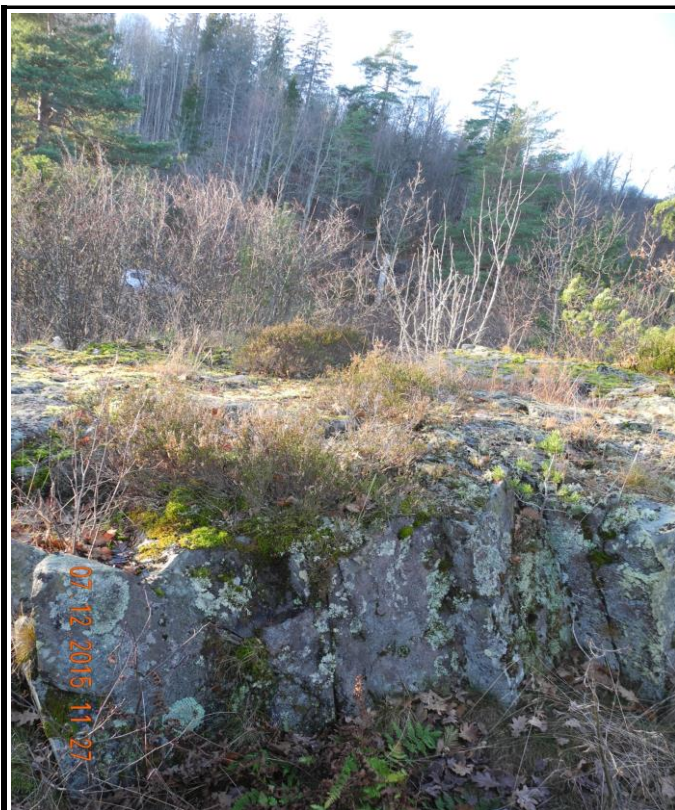
Fotografier - H :