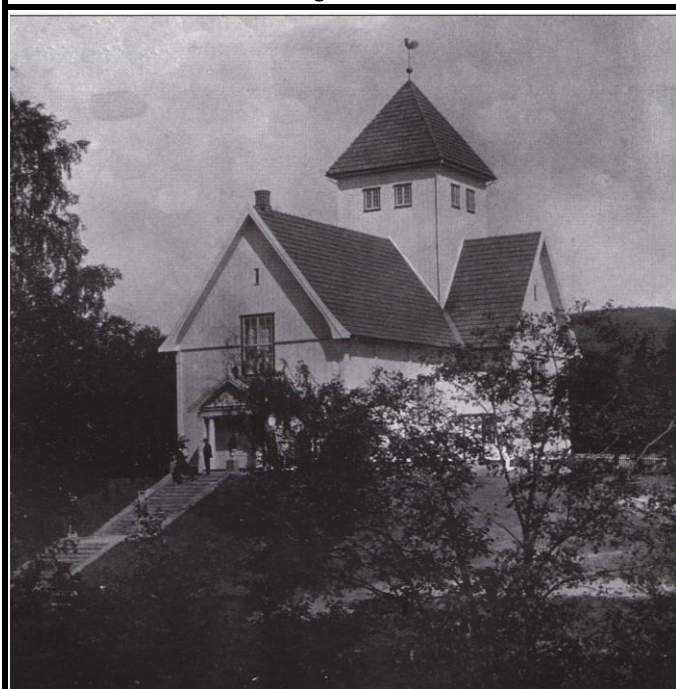
Fotografier - F :