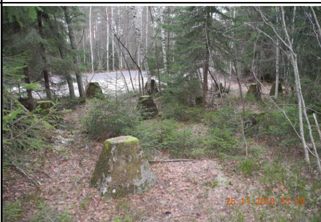
Fotografier - E :