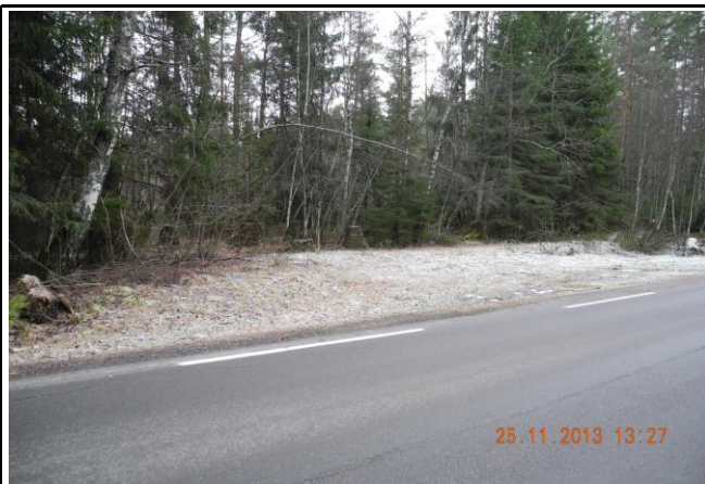
Fotografier - D :