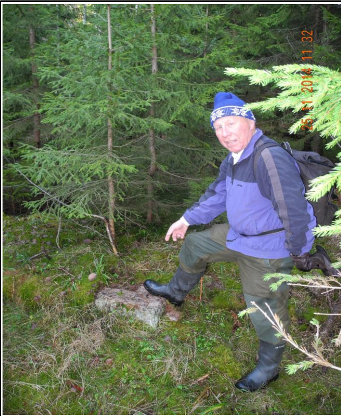
Fotografier - B :