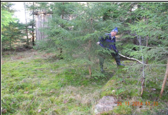
Fotografier - D :