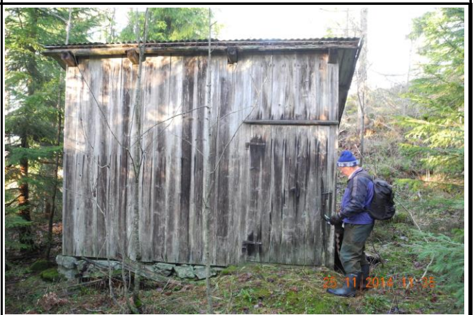
Fotografier - E :