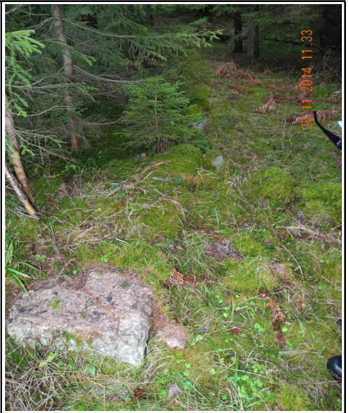
Fotografier - C :