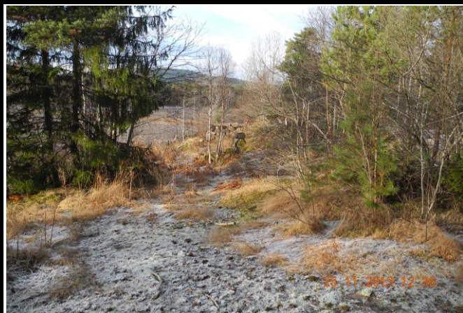
Fotografier - F :