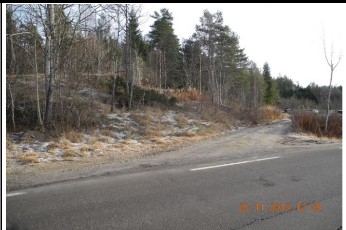
Fotografier - G :