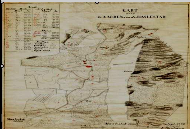
Fotografier - D :