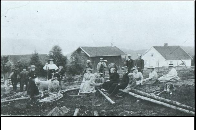
Fotografier - E :