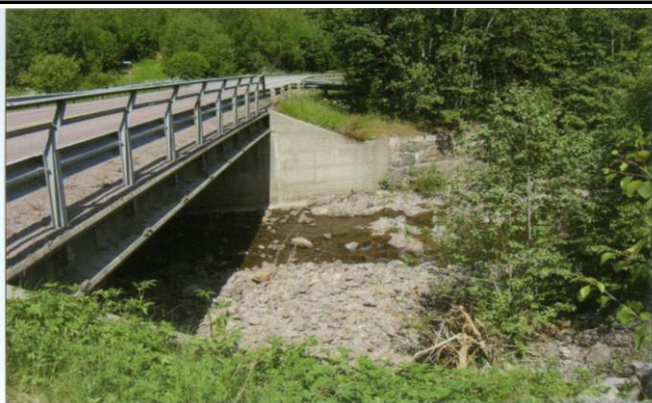
Dette er den nye broen som Vegvesenet satte opp i 1972. Til høyre ser vi fundamentet til den gamle jernbanebroen. Det er liten vannføring i Lianelva, men i gamle dager hadde man dammer for oppsamling av vann, slik at man fikk nok vann til fløtingen.