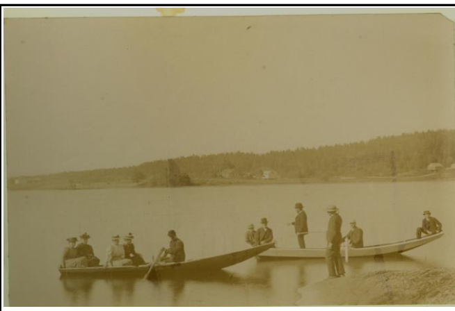
Fotografier - C :