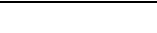
Fotografier - I :