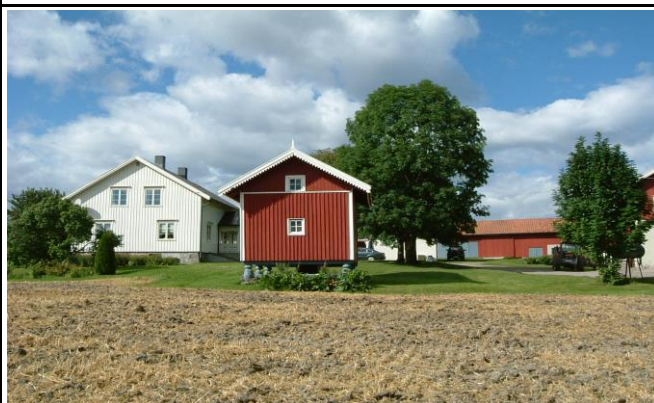
Fotografier - E :