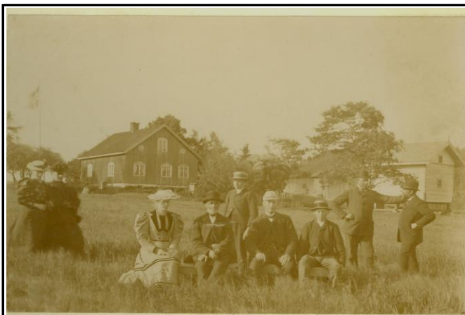
Fotografier - B :