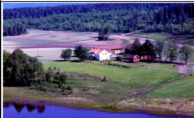
Fotografier - D :