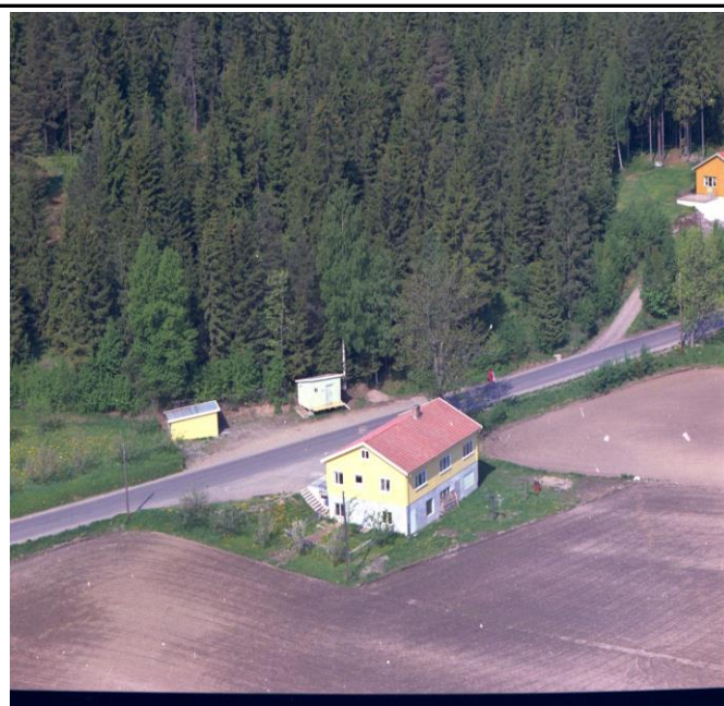
Fotografi - C :