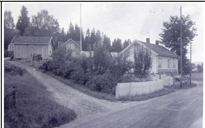
Fotografi - C: