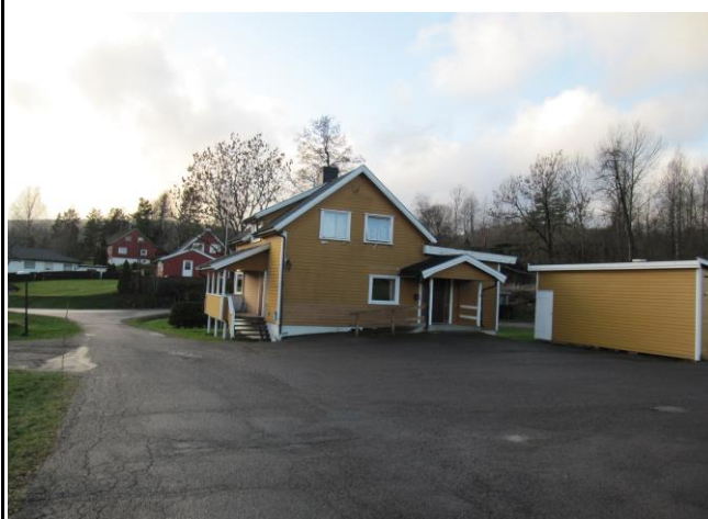
Fotografier - C :