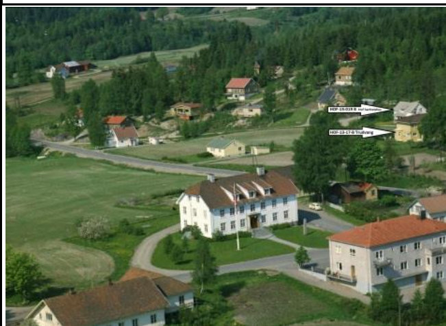
Fotografier - B :