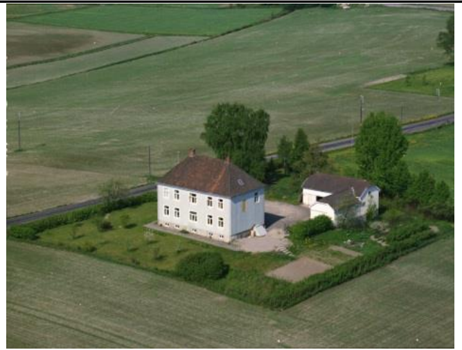
Fotografi - C :