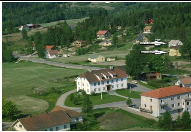
Fotografier - B: