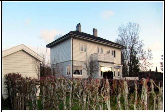
Fotografier - C: