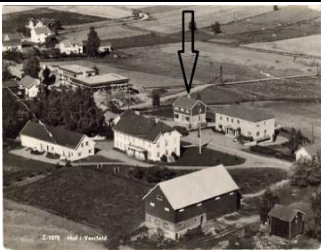
Fotografi - B