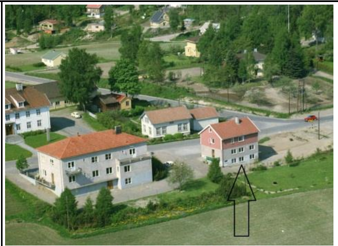
Fotografier - C: