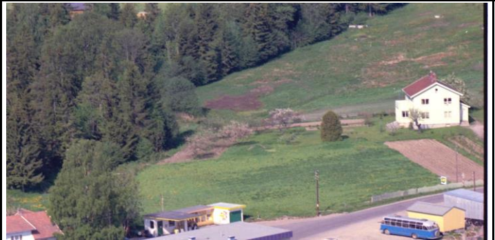
Fotografi - C