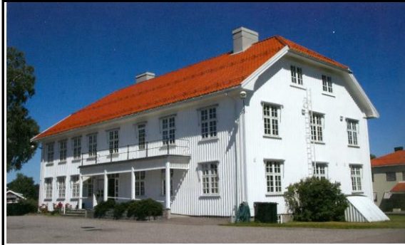
Fotografier - F :