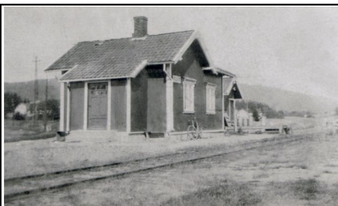
Fotografier - G :