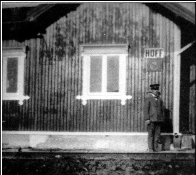
Fotografier - H :