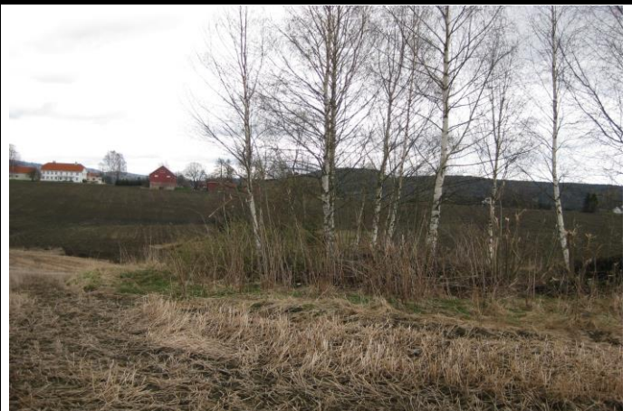
Fotografier - D :