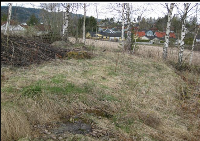
Fotografier - C: