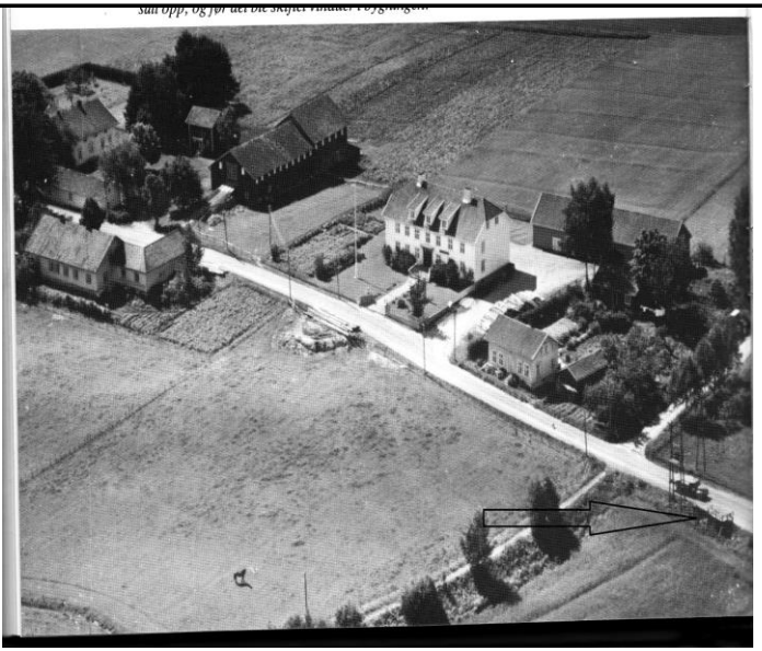
Fotografier -C :