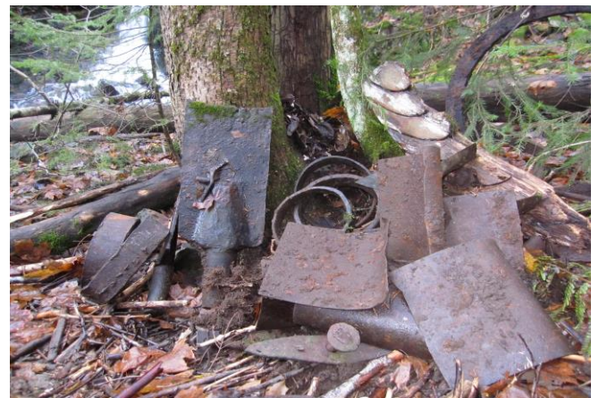
Fotografier - E :