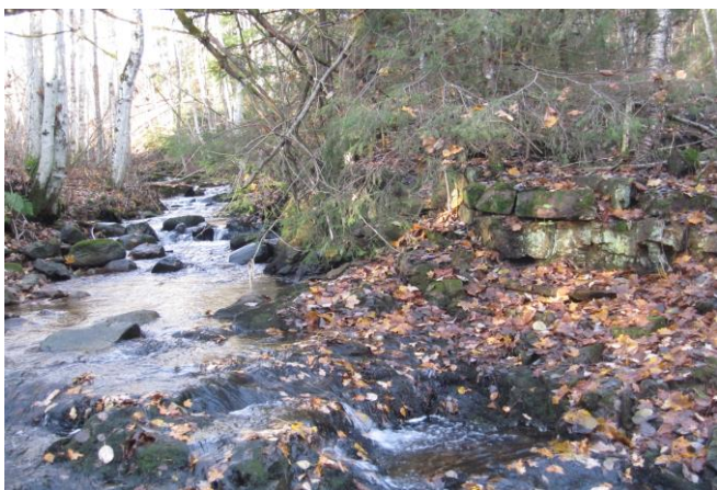
Fotografier - D :