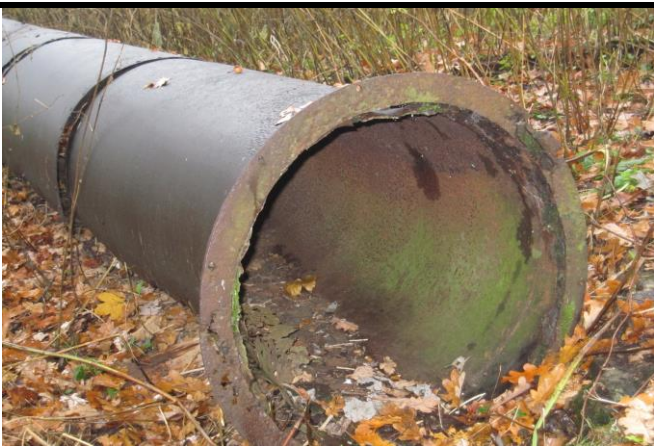
Fotografier - F :