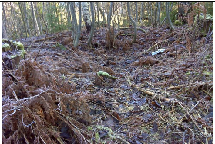
Fotografier - B :