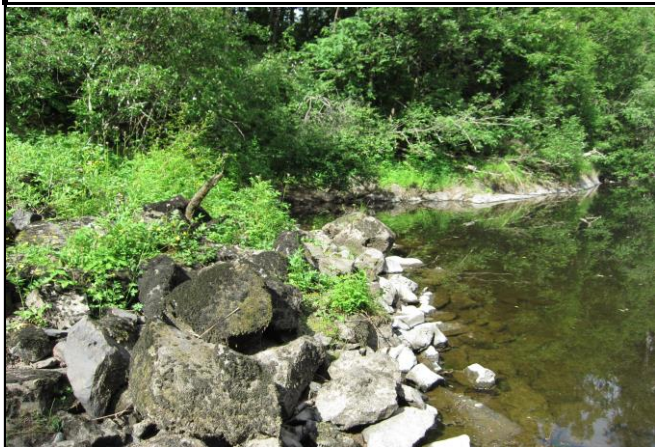
Fotografier - B : Fotografier - C :