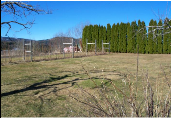
Fotografier - D :