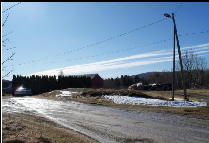
Fotografier - F :