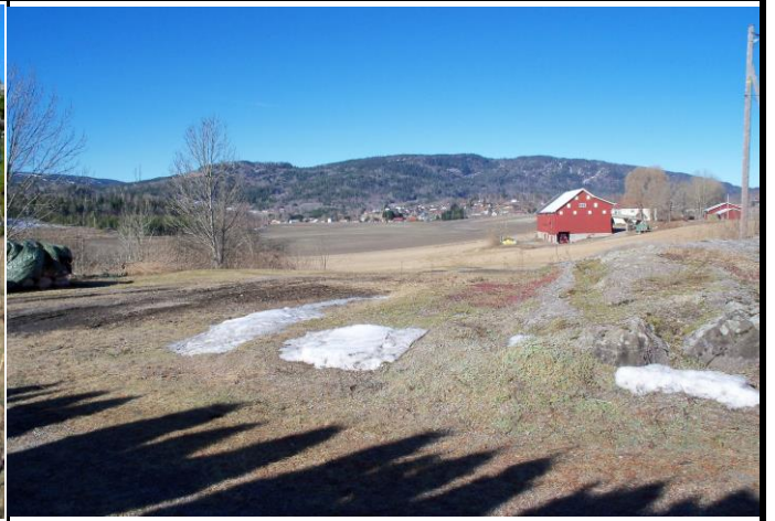
Fotografier - E :