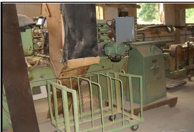
Fotografier - J :