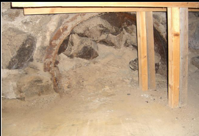
Fotografier - H :