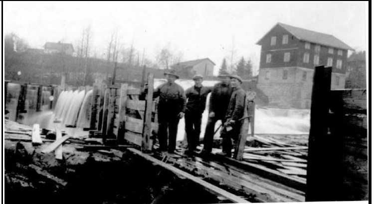
Fotografier - E :