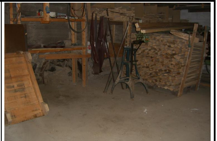
Fotografier - I :