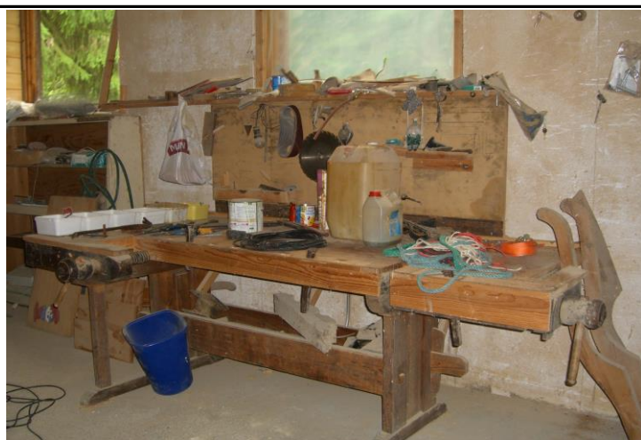
Fotografier -K :