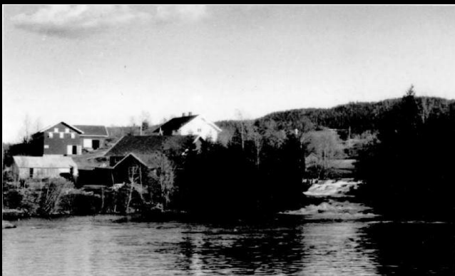
Fotografier - F :