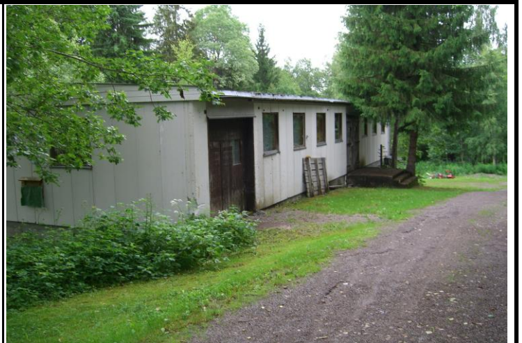
Fotografier - G :