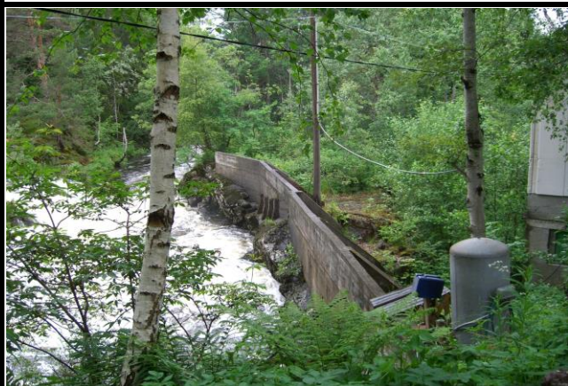
Fotografier -L :