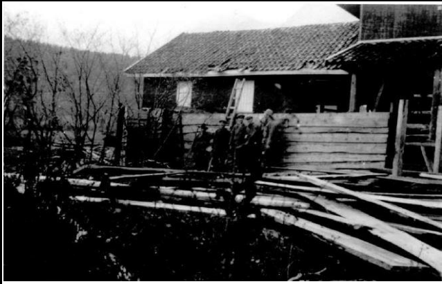
Fotografier - D :