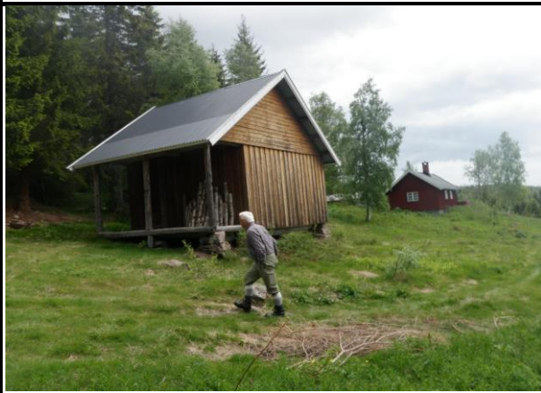
Fotografier - F :