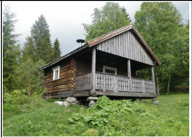
Fotografier - E :