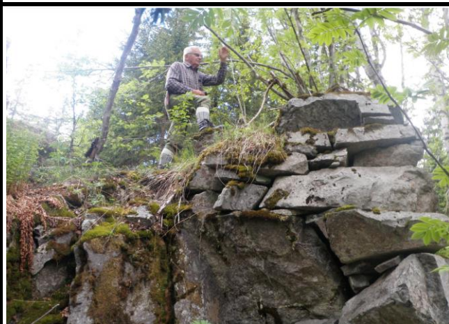
Fotografier - F :