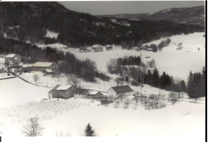
Fotografier - E :