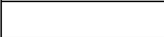
Fotografier - F :