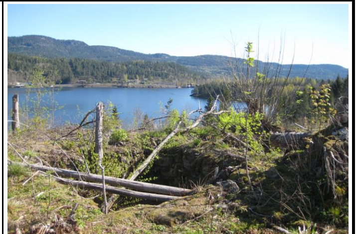
Fotografier - E :