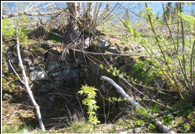
Fotografier - D :