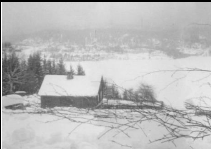
Fotografier - F :