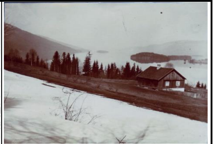
Fotografier - G :