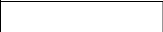
Fotografier - E :