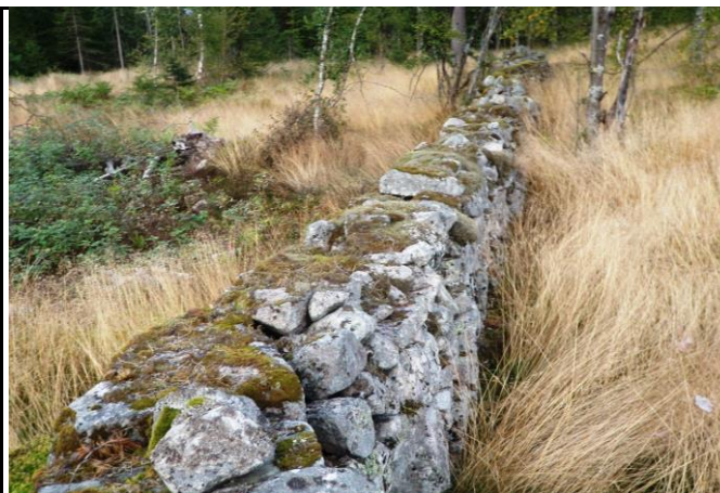
Fotografier - C :