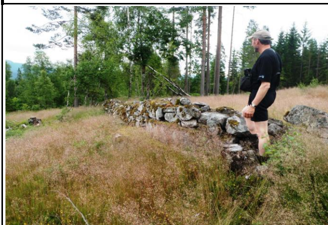
Fotografier - B :