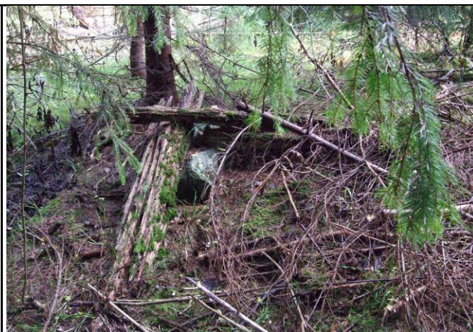
Fotografier - C :