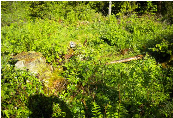
Fotografier - B :