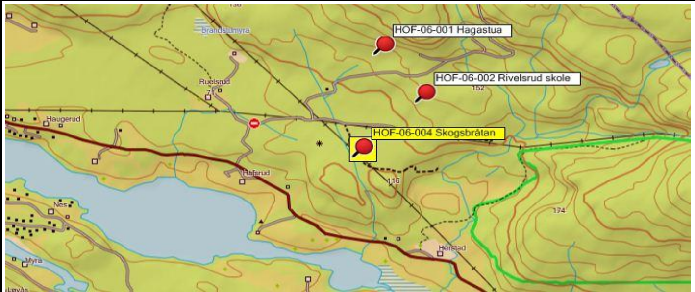
Fotografier - A :