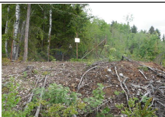
Fotografier - C :