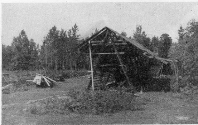
Bilde 1. Kornstøkeren på Torrud 1944, nå på Vestfold Fylkesmuseum.